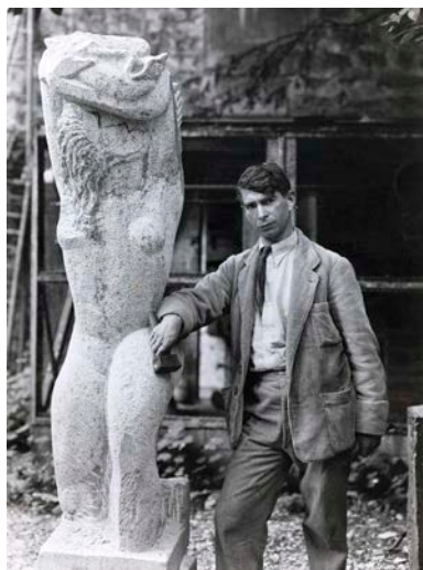
Marc Vaux, Zadkine posant dans le jardin de la rue d'Assas, à côté de la Femme à l'oiseau , 1931. Épreuve gélatino-argentique, 21,6 x 16,4 cm. Paris, musée Zadkine © Adagp, Paris, 2022 Photo © Musée Zadkine/Paris Musées