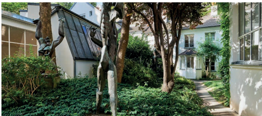
Jardin et façade du musée Zadkine, Paris

Andréa Longrais : 01 80 05 40 68 andrea.longrais@paris.fr