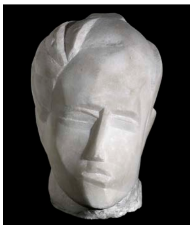
Ossip Zadkine, Tête de jeune fille , 1914, Marbre, 22,5 x 15,5 x 17 cm. Musée de Grenoble. Ville de Grenoble, © Adagp, Paris.