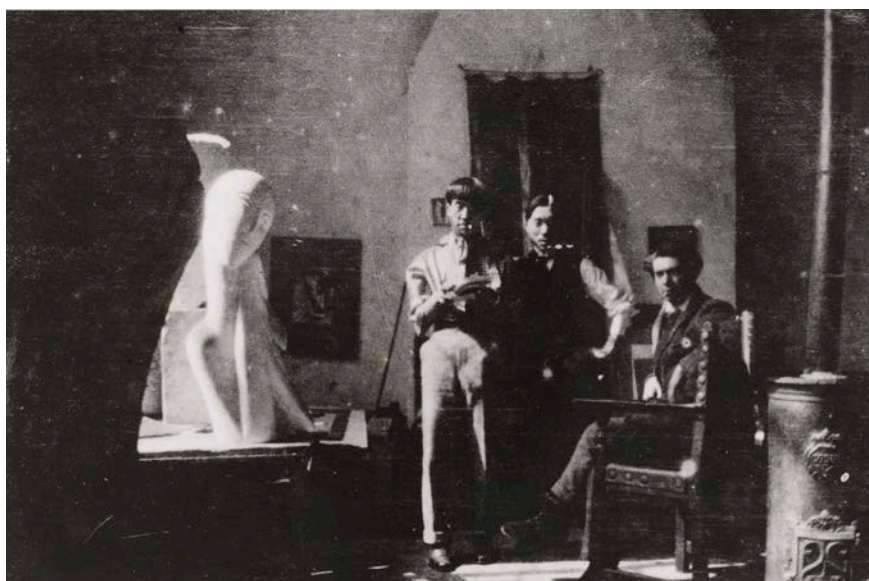
Anonyme, Zadkine dans son atelier rue Vaugirard, en compagnie du peintre Foujita . Vers 1914 Épreuve gélatino-argentique, 11 x 16 cm . Paris, musée Zadkine © Adagp, Paris, 2022

Depuis les premiers ateliers que Zadkine a peuplé de ses sculptures dès son arrivée à Paris en 1910 jusqu'à l'atelier du jardin que le sculpteur s'est fait construire après-guerre, le parcours de l'exposition suit un principe chrono-thématique. Une partie introductive raconte les premiers ateliers dans lesquels Zadkine a vécu et travaillé, au cœur du quartier Montparnasse. Le second chapitre est consacré à la maison-atelier de la rue d'Assas où il s'installe en 1928 avec Valentine Prax, qu'il a épousée en 1920. La troisième et dernière section propose de se plonger dans le processus de création et l'effervescence de la vie de l'atelier.