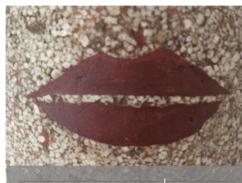
Zadkine vers l'âge de 20 ans Zadkine dans son atelier Détail de l'œuvre de Zadkine intitulée « Tête de Femme »

MUSÉE ZADKINE 100 BIS RUE D'ASSAS 75006 PARIS Tél. 01 55 42 77 20 Ouvert tous les jours de 10h à 18h Sauf le lundi et certains jours fériés www.zadkine.paris.fr